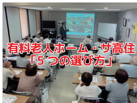
■2019年7月18日 世田谷の入居者評価の高いホームへ訪問