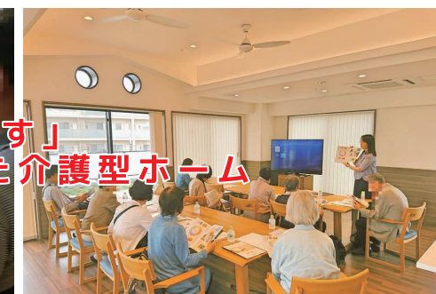
■2019年11月5日 JASS倶楽部、介護情報館「友の会」 合同見学会