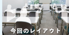
今回のレイアウト