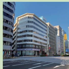
郵船茅場町ビル外観