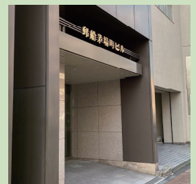
郵船茅場町ビル入口